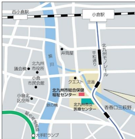
北九州市総合保健福祉センター（アシスト21） 北九州市小倉北区馬借一丁目7番1号