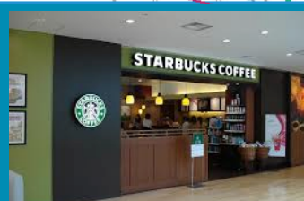
スターバックスの奥から入る